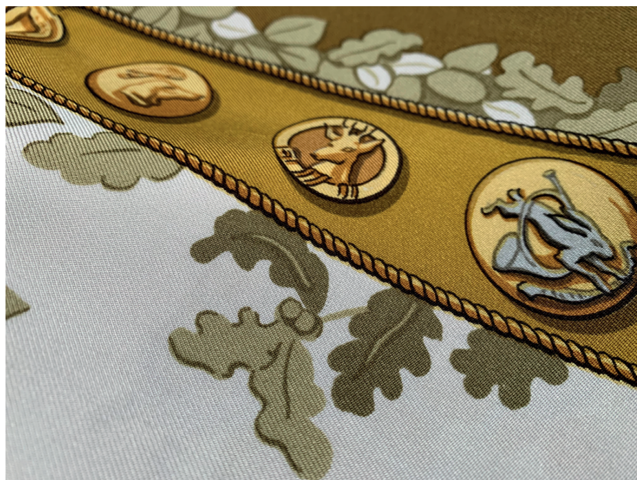
Fragment apaszki „Le Debuche”, Charles Hallo, 1969