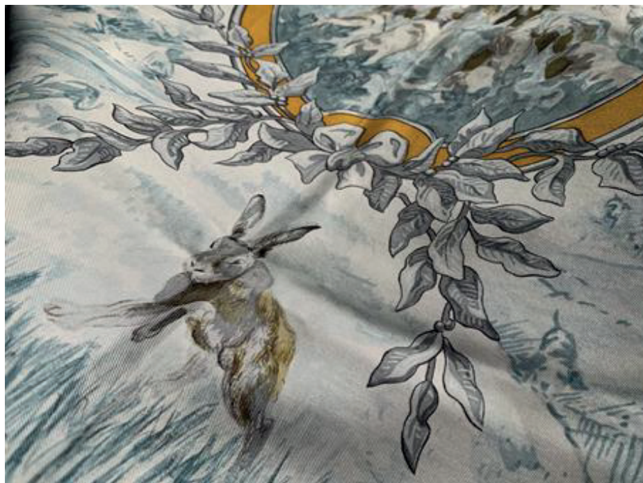
Fragment apaszki „Petite Venerie”, Charles Hallo, 1968