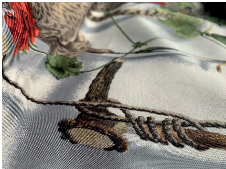
Fragment apaszki „Fleurs et Gibiers”, Henri de Linares, 1962